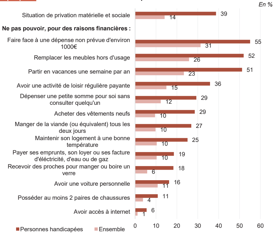
Graphique 1 Privation matérielle et sociale et privations déclarées en 2022

Lecture > En 2022, en France métropolitaine, 39 % des personnes handicapées âgées de 16 à 64 ans sont en situation de privation matérielle et sociale, et 55 % ne peuvent pas faire face à une dépense non prévue d'environ 1 000 euros pour des raisons financières. Ces proportions s'élevaient à 14 % et 31 % respectivement dans la population générale.