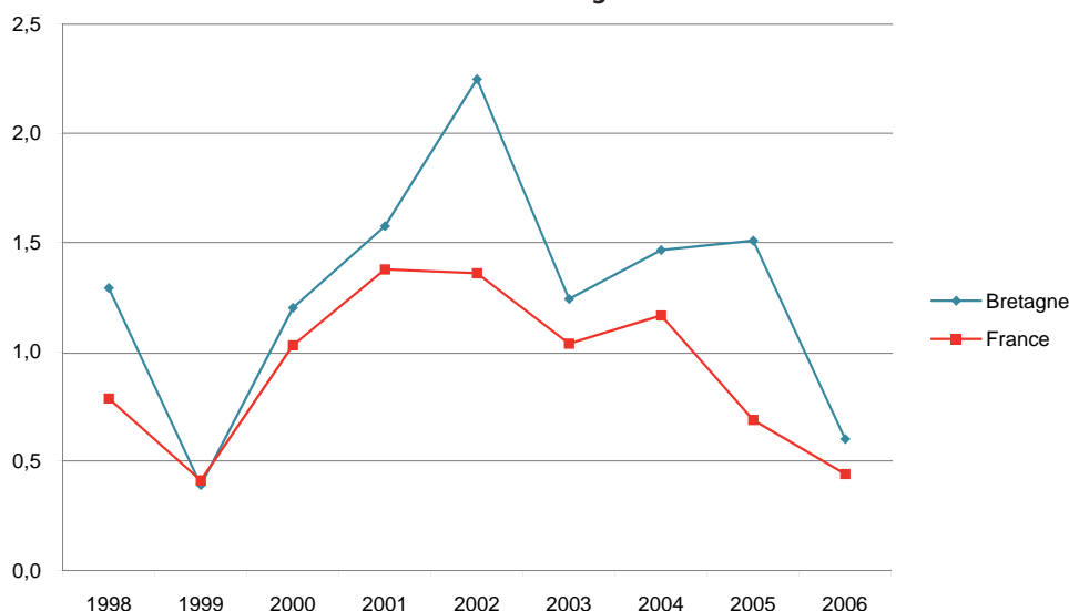
Graphique 2 : Taux de croissance du nombre de médecins en France et en Bretagne

Source : DREES - Ministère de la santé, de la jeunesse et des sports. Répertoire ADELI