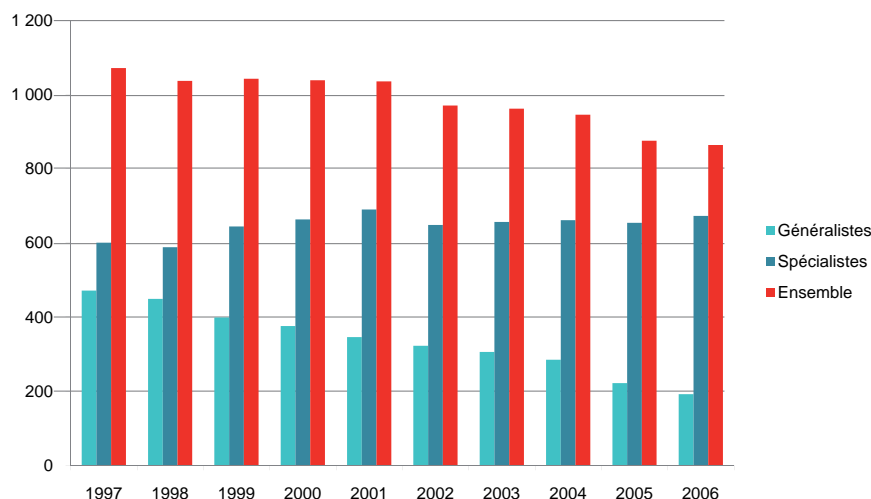
Graphique 3 : Evolution du déficit du nombre de médecins en Bretagne