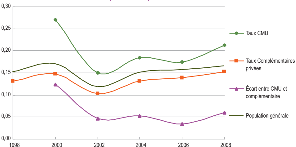
GRAPHIQUE 1 ● Évolution comparée du renoncement des bénéficiaires de la CMUC et des détenteurs d'une couverture complémentaire privée

Le lien entre âge et taux de renoncement suit une courbe en cloche : le renoncement déclaré augmente continuellement de 18 à 40 ans, se stabilise entre 40 et 50 (maxi-